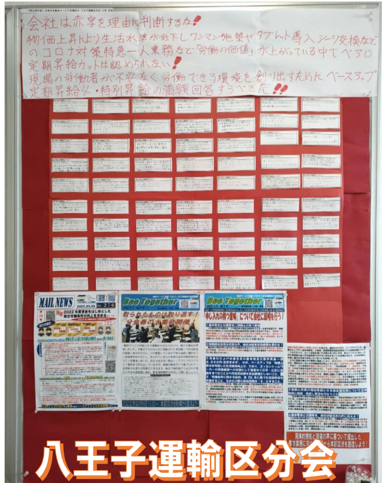
八王子運輸区分会